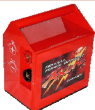
ウルトラブースター本体

◎A-SZ22は、AXON製ジョイントケーブルWタイプケーブルとAXON製ウルトラブースター本体とで二輪車(バイク)のエンジンクランキングするときに使用出来ます。(左記写真)