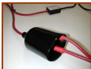
A-SZ22 ジョイント部にWタイプケーブルのワニクチをジョイントした後、

手順4:ウルトラブースターの出力スイッチをONにして車輛のエンジンクランキングをスタートしてください。