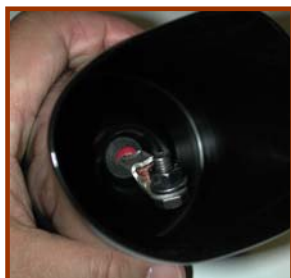
A-SZ2ゴムラバー内ジョイント部

手順2:AXON製Wタイプケーブルのワニクチ(+・-)をA-SZ2のゴムラバー内ジョイント部(+・-)に接続してください。(左記写真)