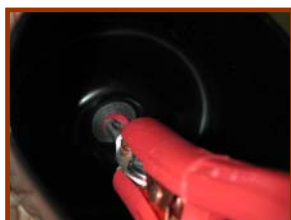
A-SZ2ジョイント部にWタイプケーブルのワニクチをジョイントした状態

手順2:AXON製Wタイプケーブルのワニクチ(+・-)をA-SZ2のゴムラバー内ジョイント部(+・-)に接続してください。(左記写真)